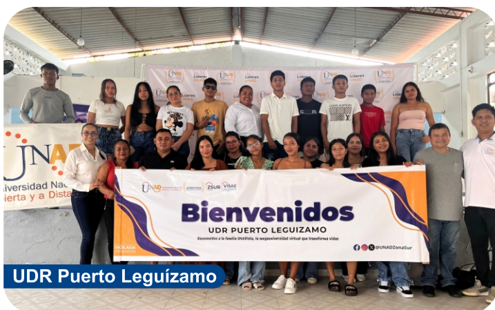
UDR Puerto Leguízamo

La inducción presencial se vivió en cada centro de la UNAD Zona Sur. Con alegría se dio la bienvenida a quienes inician una nueva etapa de sueños y aprendizajes. Este primer encuentro permite conocer el campus virtual, los procesos académicos y al equipo humano que acompañará su camino. Hoy comienza una historia de retos, logros y oportunidades.