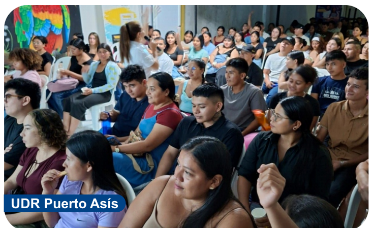
UDR Puerto Asís