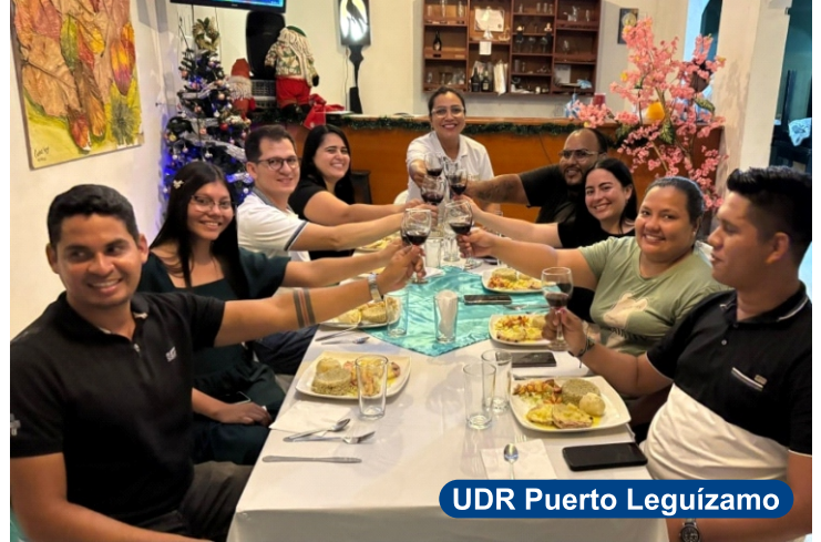
UDR Puerto Leguizamo