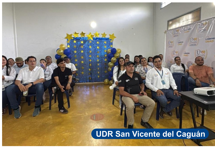
UDR San Vicente del Caguán