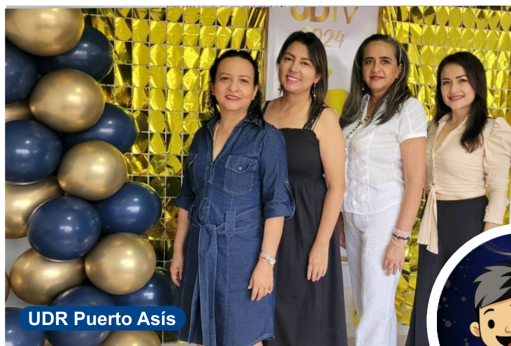
UDR Puerto Asís