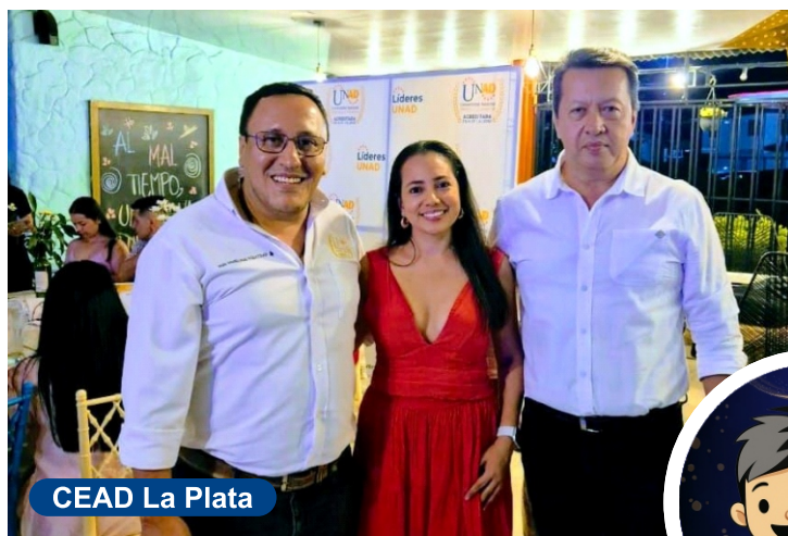
CEAD La Plata