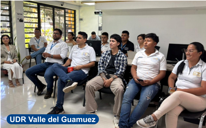
UDR Valle del Guamuez