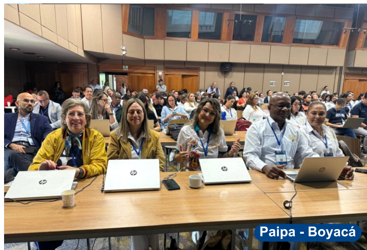
Paipa - Boyacá