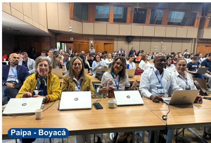
Paipa - Boyacá