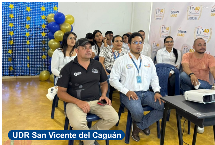
UDR San Vicente del Caguán