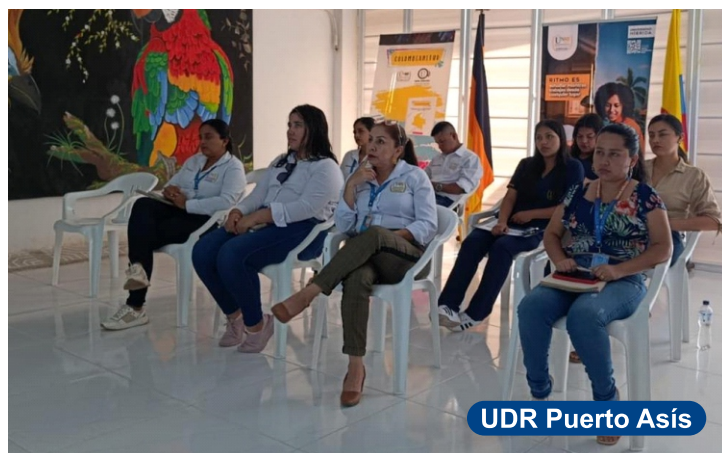
UDR Puerto Asís