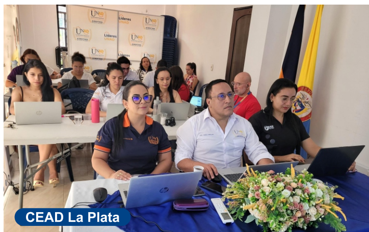
CEAD La Plata