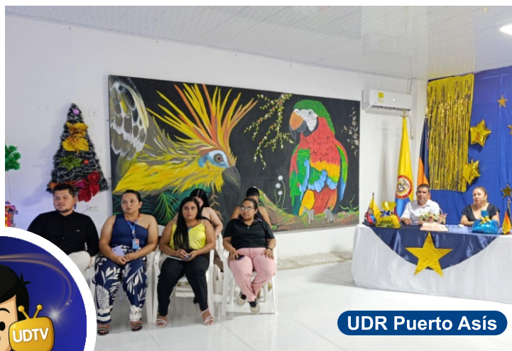
UDR Puerto Asís