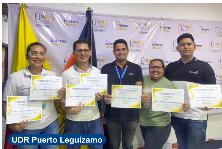
UDR Puerto Leguizamó