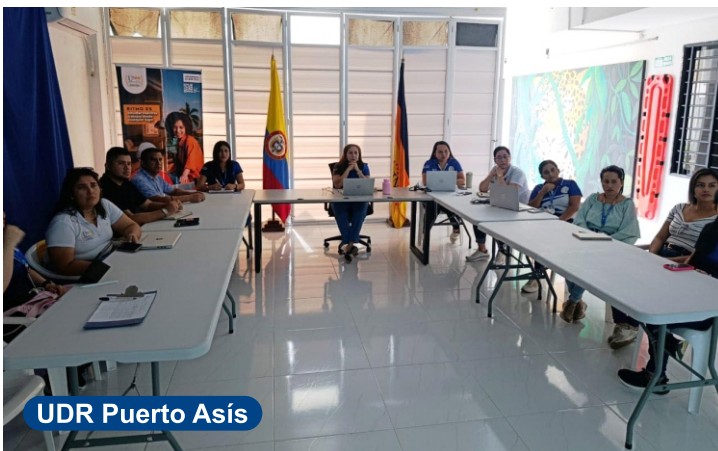
UDR Puerto Asís