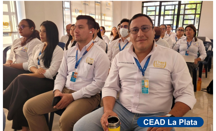
CEAD La Plata