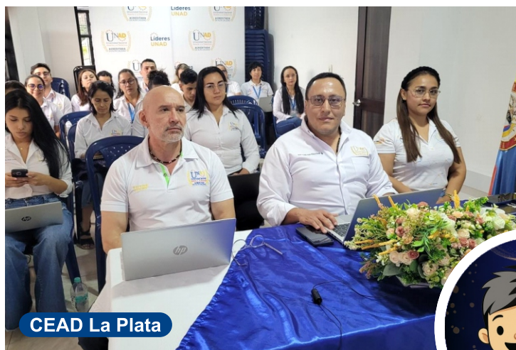
CEAD La Plata