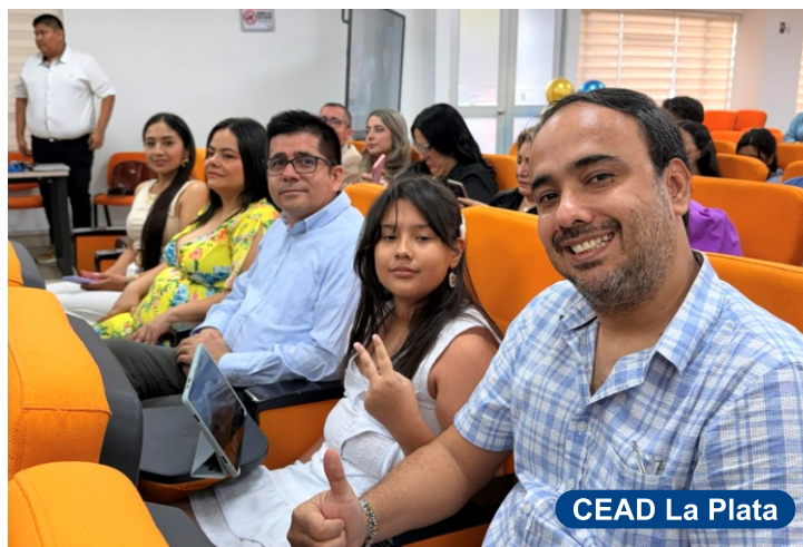
CEAD La Plata