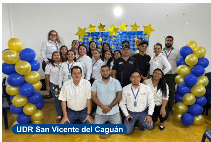
UDR San Vicente del Caguán