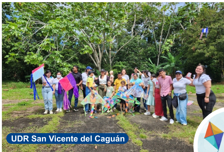
UDR San Vicente del Caguán