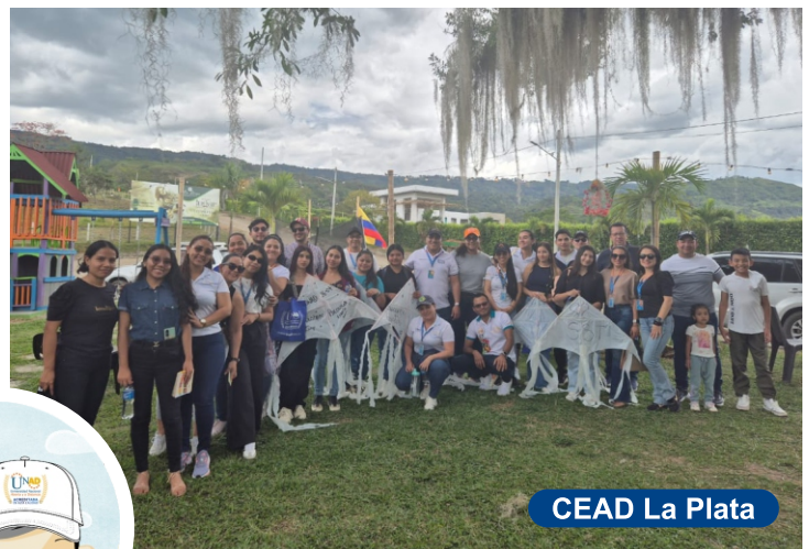
CEAD La Plata