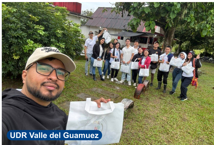
UDR Valle del Guamuez