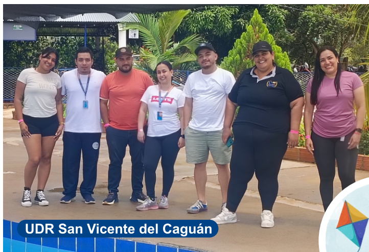
UDR San Vicente del Caguán