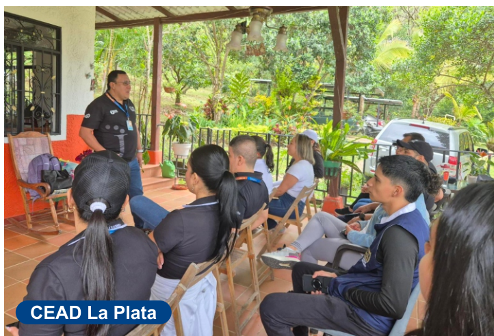
CEAD La Plata