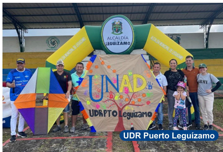
UDR Puerto Leguizamo