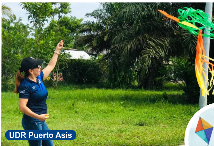
UDR Puerto Asís