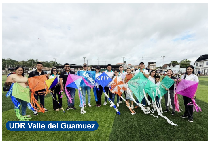
UDR Valle del Guamuez