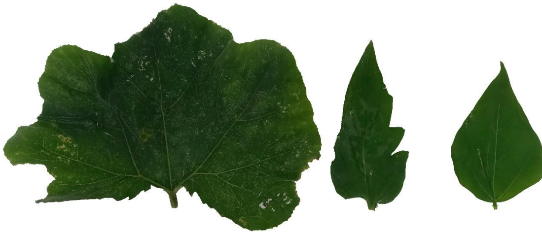
Figura 1. De izquierda a derecha, hojas de zapallo (Cucurbita moschata), tomate (Solamun lycopersicum) y habichuela (Phasealus vulgaris).

de solubilización. Las hojas fueron reducidas de tamaño, exentas de nervadura y se tomó como muestra 5 gramos, los cuales fueron maceradas con el respectivo solvente (alcohol etílico- acetona), el líquido obtenido se centrifugó para eliminar los sólidos en suspensión, luego se colocó en cajas Petri y como capilar se empleó papel filtro marca Whatman. Se dejó la muestra en suspensión por espacio de una hora y se analizaron los resultados.