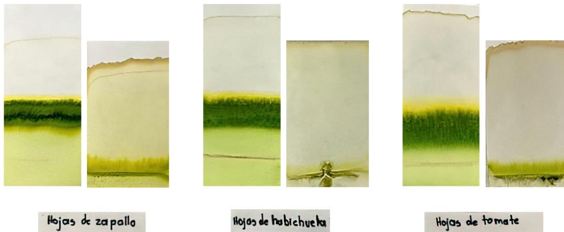
Figura 2. Izquierda, muestras maceradas con acetona; derecha, muestras maceradas con alcohol etílico.

Cada pigmento tiene una migración diferencial, que depende de sus características físicas y fuerzas intermoleculares que interactúan con hidroxilos libres de la celulosa del papel y con el solvente empleado. Según el color de los pigmentos en las tres muestras (zapallo, tomate y habichuela), se identificó que las hojas poseen pigmentos pronunciados de color verde y amarillo, donde el pigmento verde corresponde a la presencia de clorofila y el pigmento amarillo a carotenos y xantofilas, según Torossi (2007) las xantofilas poseen pigmentación amarilla, son derivados oxigenados de los carotenos y son solubles en alcohol, siendo las más abundantes la luteína y la violaxantina.