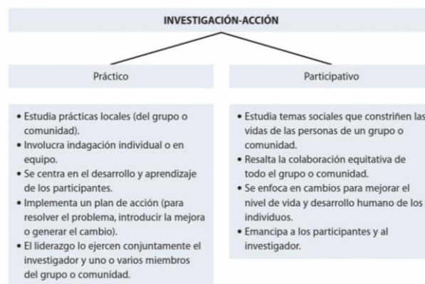
Figura 3. Investigación – Acción.