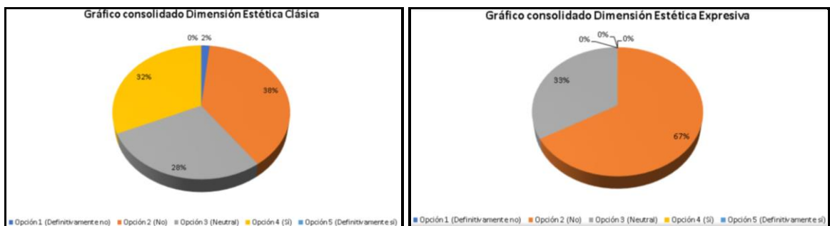
Fig. 3. Gráficos consolidados por dimensión sitio web de entretenimiento.

De acuerdo con la percepción de los participantes, en un 75% este sitio web tiene atributos de estética clásica y en un 50% atributos de estética expresiva; por lo tanto, se puede inferir como hallazgo inicial, que la experiencia para los usuarios en aspectos relacionados con belleza fue satisfactoria.