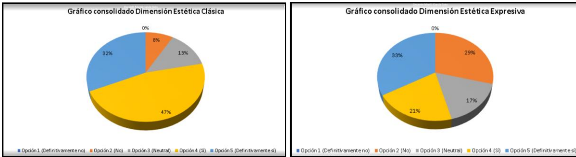
Fig. 4. Gráficos consolidados por dimensión sitio web de comercial.

Para los participantes, el sitio web comercial definitivamente presenta atributos relacionados con la estética expresiva en un 33% en contraste con los demás tipos de sitios web evaluados, debido a que el nivel porcentual fue mayor en esta dimensión.