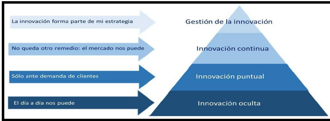
Figura 1. Innovación como proceso empresarial

Como indica Roberto de la Vega (2017), luego de consultar 961 empresas medianas, evidencia que estas se han enfocado en procesos para optimizar costos y tiempos de producción y muy pocas realizan innovación de valor agregado en productos, servicios o modelos de negocio, dejando a un lado las innovaciones que generan mayores beneficios como la innovación incremental o la radical.