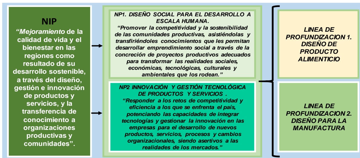
Ilustración 2. Relación de la denominación con el NP, los NIP y el desarrollo curricular.

La construcción del programa de diseño industrial se ha realizado desde los lineamientos establecidos por el acuerdo 001 del 2013 de la UNAD y se expresa en la Ilustración 2.