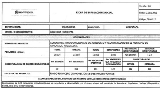
Fig. 2. Acta viabilización proyecto PCI Aracataca a partir de documentos internos MVCT (2016).