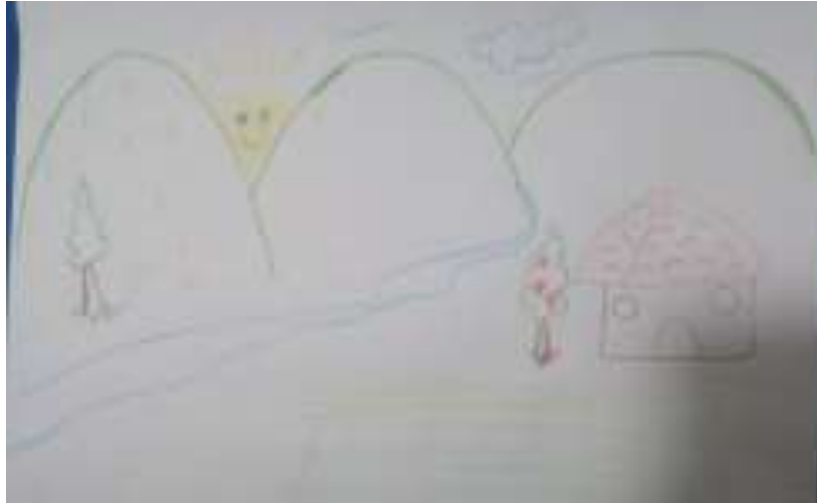
Imagen No 2: Representación gráfica de un participante momento 1.

montañas, todo es netamente plano. (Ver Imagen No 2)