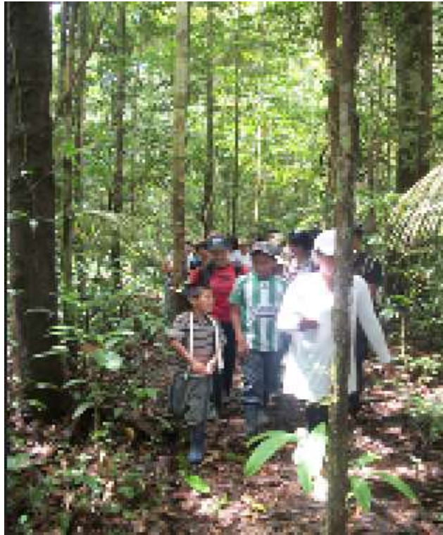
Imagen No 1. Recorrido de interpretación por los Senderos de la Reserva Agape.

Para la recolección de la percepción y conocimientos previos que traían los niños, se utilizó los métodos de investigación visual (dibujo). Este método es muy útil a la hora de trabajar con niños pequeños y permite estimular y motivar la participación, ya que crea un ambiente relajado y divertido para la investigación. Como es una actividad que realizan normalmente en el colegio o la casa, se sienten cómodos en desarrollarla y en ella pueden plasmar lo que quieran. Esta técnica del dibujo es una forma de expresión personal y una forma natural de comunicación por lo que se convierte en un método para que los niños representen las