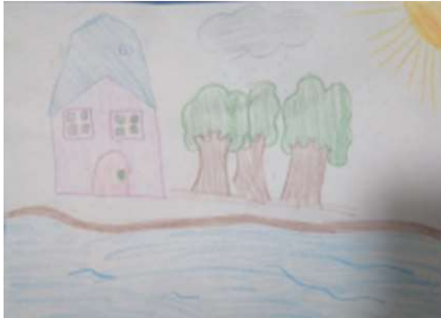
Imagen No 3. Dibujo de un participante en el momento 1. Fuente: autora con el permiso de la Fundación Amazonía Eware.

cada uno, con el fin de convertir esta información cualitativa en cuantitativa. Este es un ejemplo de dibujo (Ver imagen No 3).