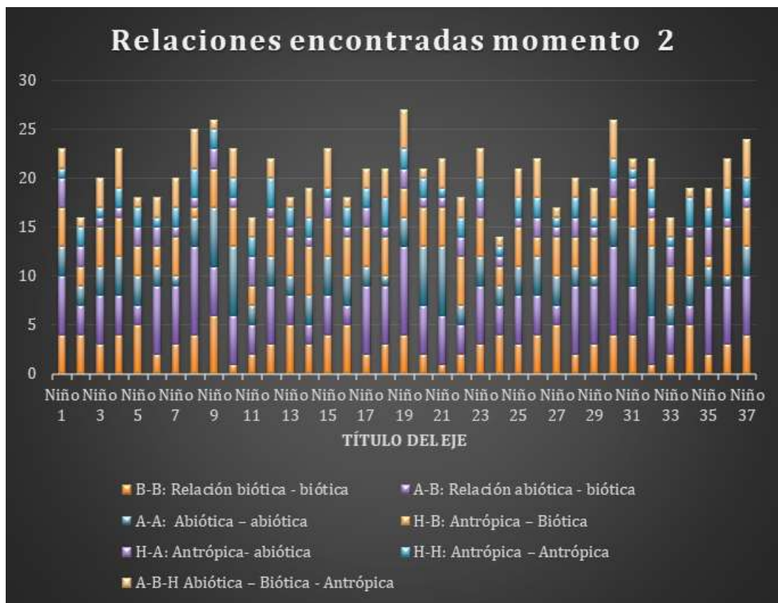
Gráfico No 2. Relaciones encontradas en los dibujos de los niños Momento 2.

21. El 21, 62% de los niños represento entre 11 a 13 relaciones, el 37,8 representó entre 14 a 16 relaciones en sus dibujos, el 40, 5 % incluyeron entre 17 a 21 relaciones en sus dibujos. Lo que significa que se tuvo un aumento significativo en las relaciones plasmadas por los niños de la Fase 1 y 2, de más del 200%.