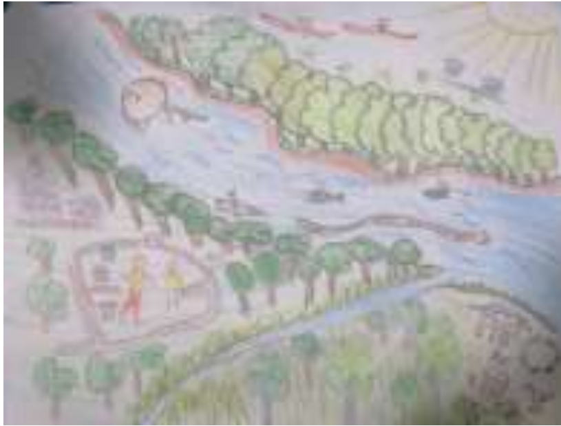
Imagen No 4. Dibujo de un participante en la Fase 2.

A continuación, en la Tabla No 2 se encuentra la evaluación obtenida del anterior dibujo.