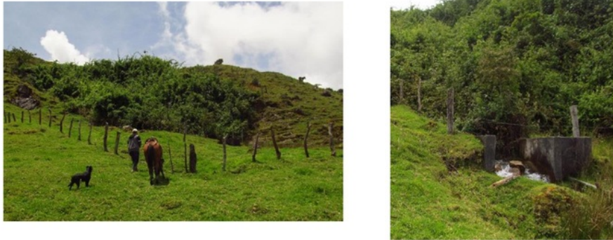
Figura 3. Panorámica Nacedero Tuquinal y estructura de encauzamiento del Nacedero

Los aforos realizados en la Quebrada Altamira arrojaron un caudal de 364.7L/s para el mes de junio de 2016 y 313.3L/s para el mes de enero de 2017, si bien el segundo aforo se realizó en un mes tradicionalmente seco, se habían presentado algunas precipitaciones, por lo cual no hubo un cambio significativo de caudal. En cuanto al aforo en el caño Tuquinal se encontró un caudal de 103L/s para el mes de noviembre de 2016 correspondiente a finalización de período de lluvias (tabla 2).