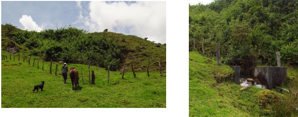
Figura 3. Panorámica Nacedero Tuquinal y estructura de encauzamiento del Nacedero

Los aforos realizados en la Quebrada Altamira arrojaron un caudal de 364.7L/s para el mes de junio de 2016 y 313.3L/s para el mes de enero de 2017, si bien el segundo aforo se realizó en un mes tradicionalmente seco, se habían presentado algunas precipitaciones, por lo cual no hubo un cambio significativo de caudal. En cuanto al aforo en el caño Tuquinal se encontró un caudal de 103L/s para el mes de noviembre de 2016 correspondiente a finalización de período de lluvias (tabla 2).