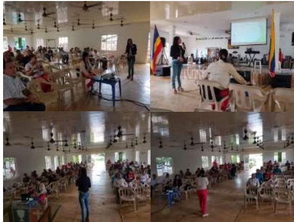
Figura 4: Socialización resultados de control de residuos sólidos

iv) Proyecto artesanal: Compostaje para producción de abono.