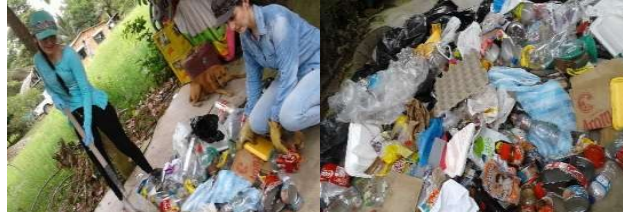
Figura 3: Cuarteo de residuos solidos

Actividad 3: Se realizó un cuarteo de identificación de residuos utilizando el método descrito por Taboada en 2009. En cada vivienda, se recolectaron los residuos de un día sin contar con los residuos peligrosos como por ejemplo el papel sanitario. Posteriormente se procedió a mezclar todo rigurosamente y a fraccionar en cuatro partes, tal como se muestra en la Figura 3.