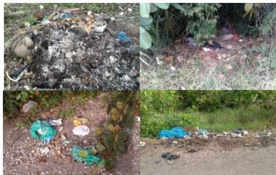
Figura 1: Problemáticas de quema e incorrecta disposición de residuos

Así mismo, se realizó la verificación de botaderos de basura aledaños a las viviendas visitadas y en cercanías de las vías principales con el ánimo de establecer el impacto sobre el medio ambiente causado por la mala disposición de sus residuos. En este caso se tomaron imágenes fotográficas en sectores que presentaron desechos o evidencia de algún tipo de proceso de quema de los mismos (Figura 1).