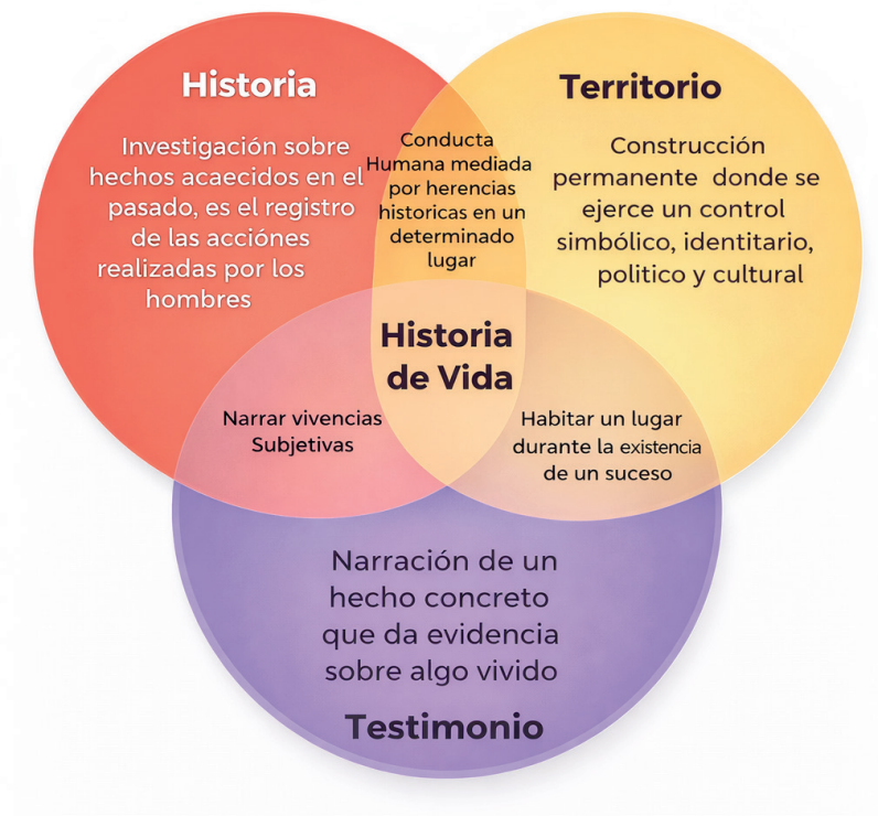
Figura 1. Elementos centrales para entender las obras de Alfredo Molano

Conocer profundamente una unidad territorial implica acercarse a la historia, pero a la contada por las personas que lo habitan. Así mismo, estar en el territorio implica contemplar todo lo que allí está habitando, no solo individuos, sino los ríos, las trochas, las montañas y las plantas. Estos elementos son parte de una construcción permanente en donde el territorio es el que está mediado por elementos simbólicos, identitarios, políticos y culturales.