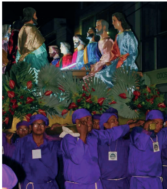
Figura 7. Santos varones en la procesión del Jueves Santo, Última Cena.