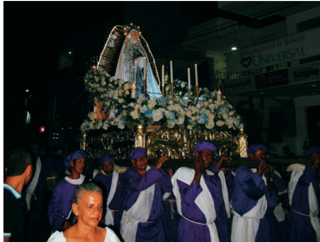
Figura 6. Cargadores llevando la imagen de la Dolorosa, Miércoles Santo.