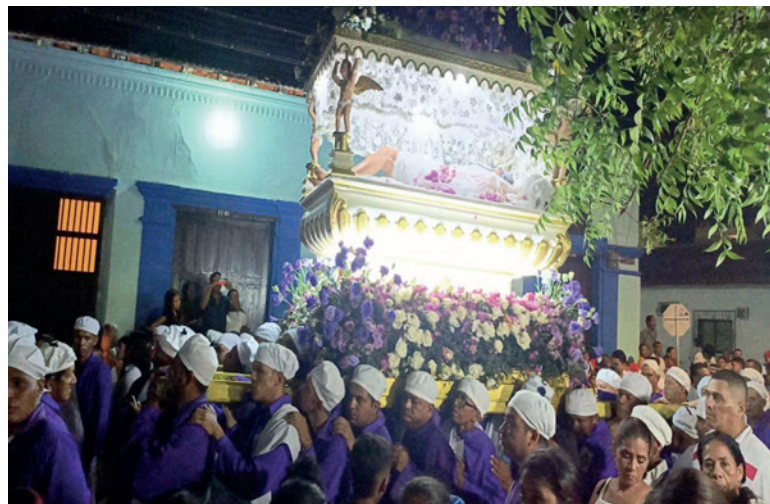
Figura 12. Procesión del Viernes Santo en anda.