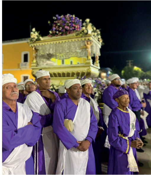
Figura 9. Santos Varones esperando el inicio de la procesión.