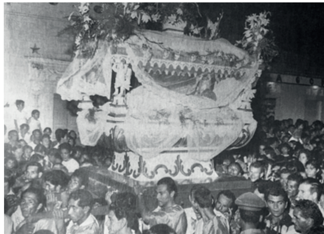
Figura 4. Santo Sepulcro.