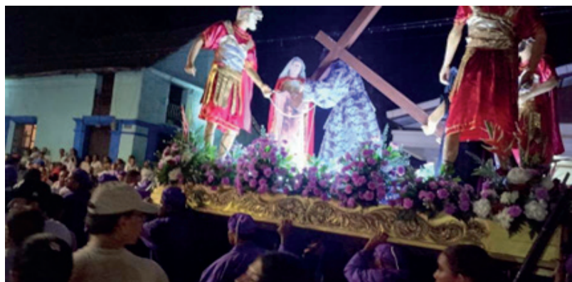
Figura 5. Miércoles Santo, cargadores llevando el Nazareno.

Nota. Misma imagen religiosa desde 1859.