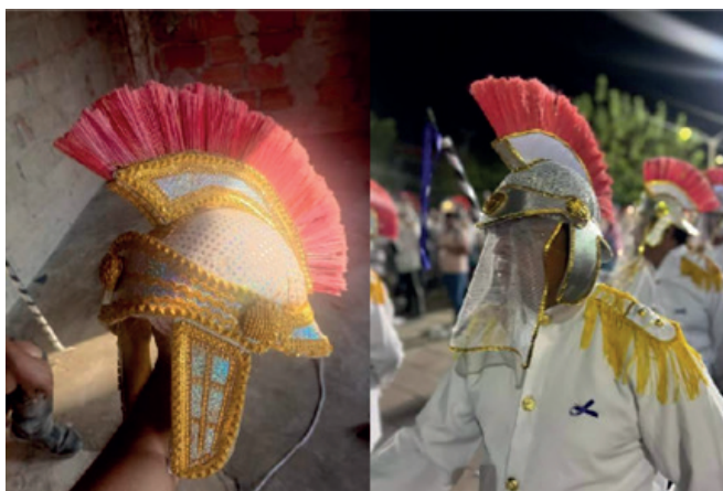
Figura 2. Casco de los centuriones; Centurión y su vestimenta representativa del Viernes Santo.