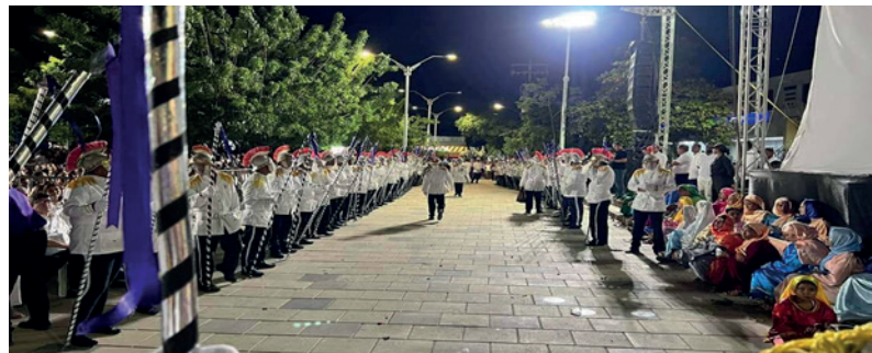
Figura 10. Centuriones en la calle de honor esperando dar inicio a la procesión en, Viernes Santo.