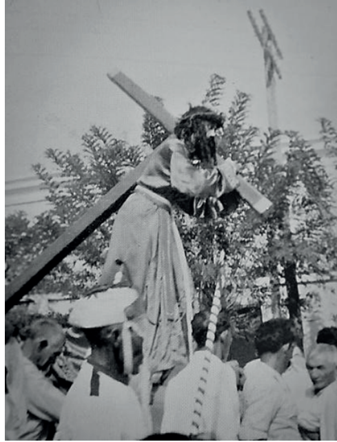
Figura 1. Procesión del Nazareno 1950