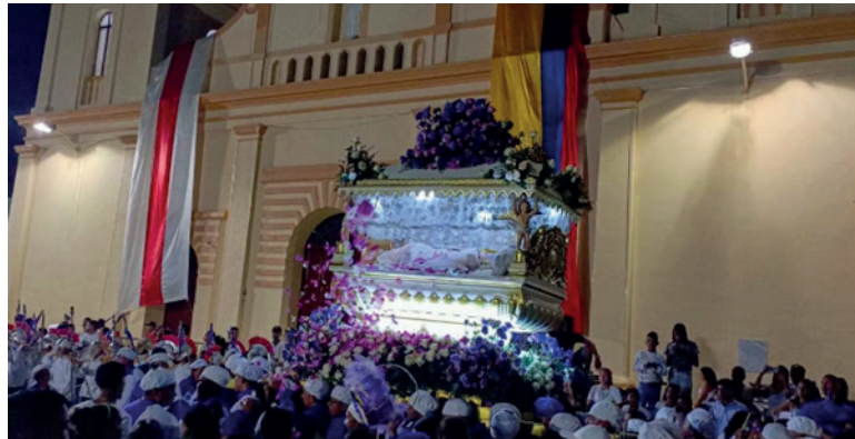
Figura 13. Santo Sepulcro llegando a la plaza principal a las 12:30 a. m. tras haber salido a las 9:00 p. m.