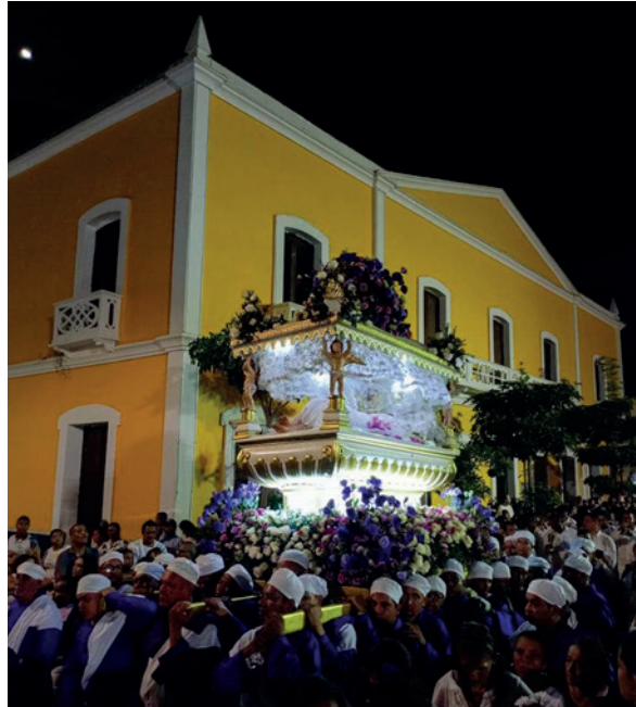
Figura 8. Los Santos varones el Viernes Santo, Santo Sepulcro.