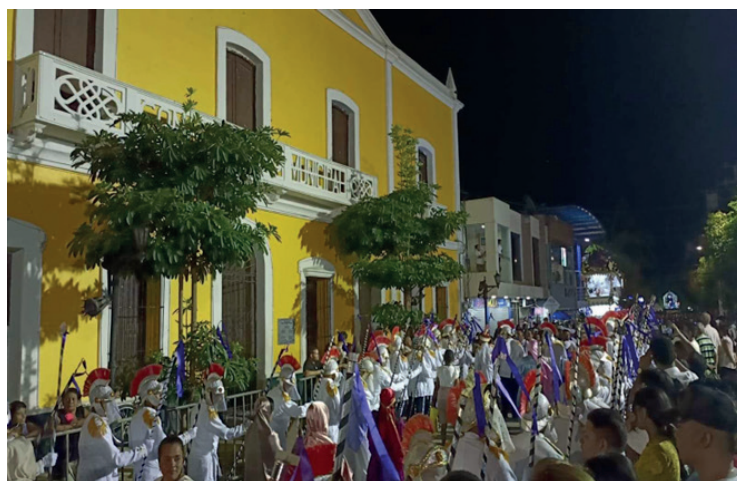
Figura 14. Personas esperando al Santo Sepulcro llegando a la plaza principal