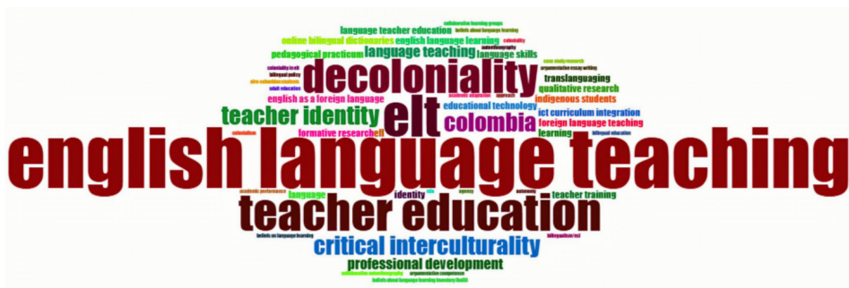
Figura 2. Coocurrencia de palabras clave.

Los términos anteriores son el foco de estudio de la mayoría de las investigaciones analizadas en esta revisión.