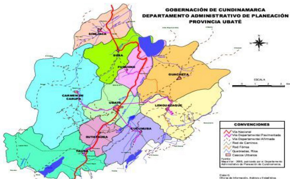
Figura 1. Mapa de la Provincia de Ubaté y sus municipios.

La Provincia está conformada por 10 municipios (ver mapa): Ubaté, Tausa, Sutatausa, Carmen de Carupa, Lenguaque, Fúquene, Simijaca, Susa, Guachetá y Cucunubá. Para la presente investigación, el estudio se centra en 4 municipios: Ubaté, Tausa, Sutatausa y Carmen de Carupa.