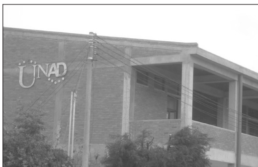
Figura 4. CEAD Facatativá

Facatativá es la capital de la provincia Sabana Occidente y es parte del área metropolitana de Bogotá. Entre los lugares más atractivos de este municipio se encuentra el Parque Arqueológico Piedras del Tunjo, el cual es comúnmente llamado “Piedras de Tunja” donde se encuentran petroglifos. Su economía es esencialmente agrícola y ganadera, se resalta el cultivo de hortalizas, frutas y flores; así mismo, posee un importante sector industrial y diversas empresas prestadoras de servicios.