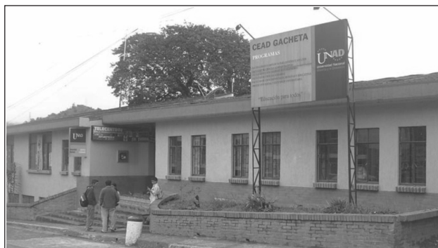
Figura 1. CEAD Gachetá

El municipio de Gachetá es la capital de la provincia del Guavio, se localiza en el nororiente del departamento de Cundinamarca, a 99 kilómetros del Distrito Capital, sobre la vía que de Bogotá conduce a Ubalá y Gachalá. Allí nace en 1985 el CEAD que lleva su nombre, el cual atiende en la actualidad alrededor de 126 estudiantes en pregrado y 164 en Bachillerato, provenientes de diferentes municipios, tanto de la región, como de la provincia de Medina.