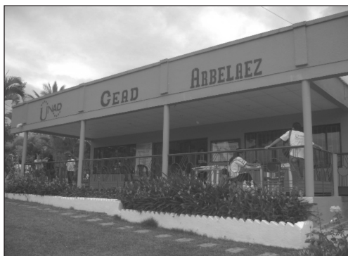
Figura 2. CEAD Arbeláez

Arbeláez se encuentra ubicado en la provincia de Sumapaz. Conocido como la “Ciudad tranquila y acogedora de Colombia”, este municipio posee una temperatura cuyo promedio anual es de 20°C. Sus principales actividades económicas son la agricultura, la ganadería y el comercio. Tiene una población de 23.420 habitantes.