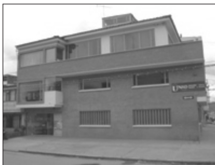
Figura 5. CEAD Zipaquirá