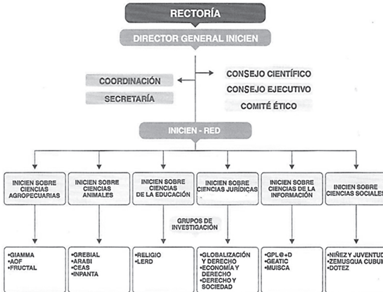
Tabla 5 ESTRUCTURA DE INICIEN.

Fuente: Organigrama de INICIEN. Proyección Científica 2012. p. 51.