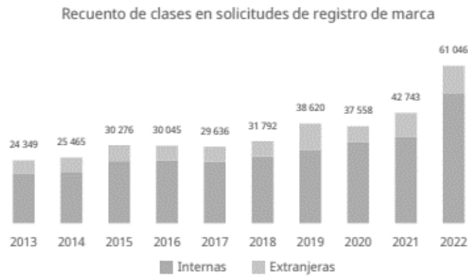
Figura 2. Marcas – Ranking 44.