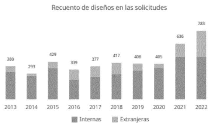
Figura 3. Diseños industriales – Ranking 66.