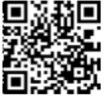
Imagen 1. Ejemplo de CFDI con Complemento para recepción de pagos (Formato SAT): Fuente: Secretaría de Hacienda y Crédito Público (SAT).

Sello digital del CFDI: GryXz6LJ+uUsxdH6+rvvgW0Ym/9BKezyYhuEjLlNymjggCTTqYJo7sQX+PS4NKTyB8MVf7IGPh+CF/ZDX2yVKOX6UHH8tgnrb6vFH1drjK7gNlMs2rGRPwa9v3zpzPvU7KthSnmBxrtGK8H064dAmL9/uaEtlglUp7VO1vBLGUebXQ0ZL7fKkUmeMAau7YbSN9GMh7JJu6cr1IvaCtsOE8iceZZEg+nk4K+RMmk+YLaLbTQ8MfgQZ24qld3rGNiAT8O0b0BBmem3QQRdheCzdpu218JnkYrFidu/Aa4ThB7KsLkcQvLE0T4MmNSpolQ8zCbPYhXg== Sello digital del SAT: G4R9d5SerXzyY9GgMNR6LIXWJqGzEJu7wWadKH5d0DvTr5hdE3LSuEVJQMmak70ezGurUK/ve2xK7DyrZdVidxdH3UWVG1x3eA9UI80kn/VQuvIFB4FP3IAH0gZIEH5HIM5cvru0k5kz1WlluhI+HXZV133wjIA4DspAnogcUzrR1Z6JaF2oNlb5Ujic4Rqvd9ERibuZ6ZAA4PF6gvWdCKZPYN0XrsU2BpHlgzOhsQjs4N8fs4Aazp06YQIm03Hi+MvV5JlM5BSZhbog+Fm3NjBNG2bsELxYVlprZ3pwJrztb30Y1OrHdHqKsNGzXDDw== Cadena Original del complemento de certificación digital del SAT: [1, 1] [2021-01-21T20:00:41]SVT110323527[GryXz6LJ+uUsxdH6+rvvgW0Ym/9BKezyYhuEjLlNymjggCTTqYJo7sQX+PS4NKTyB8MVf7IGPh+CF/ZDX2yVKOX6UHH8tgnrb6vFH1drjK7gNlMs2rGRPwa9v3zpzPvU7KthSnmBxrtGK8H064dAmL9/uaEtlglUp7VO1vBLGUebXQ0ZL7fKkUmeMAau7YbSN9GMh7JJu6cr1IvaCtsOE8iceZZEg+nk4K+RMmk+YLaLbTQ8MfgQZ24qld3rGNiAT8O0b0BBmem3QQRdheCzdpu218JnkYrFidu/Aa4ThB7KsLkcQvLE0T4MmNSpolQ8zCbPYhXg==][00001000000413073350] RFC del proveedor de certificación: SVT110323527 Fecha y hora de certificación: 2021-01-21 20:00:41 No. de serie del certificado SAT 00001000000413073350