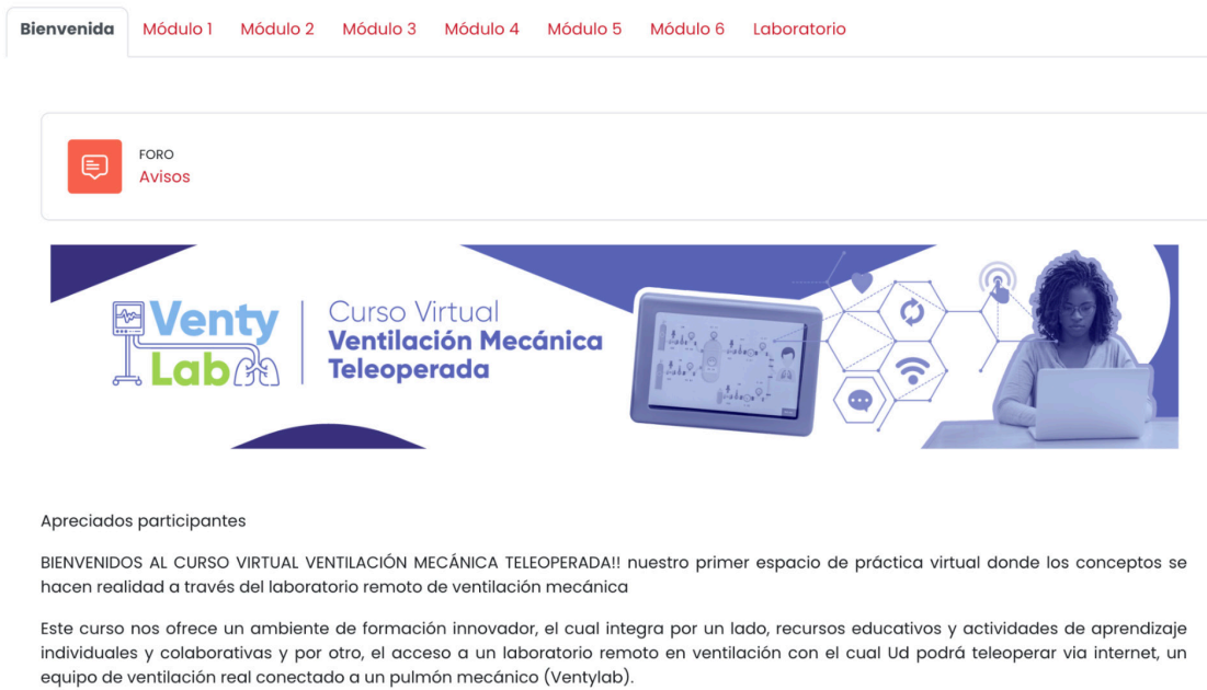
Figura 2. Página de apertura del curso y acceso a los módulos