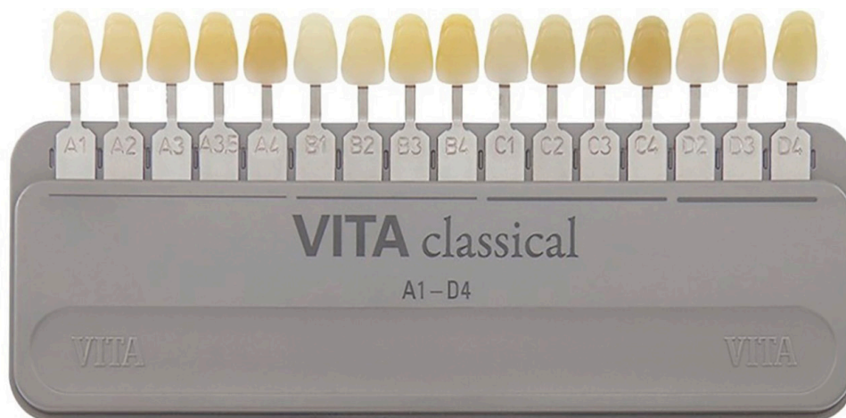
Figura 3. Escala Vita Clásica.

En la actualidad una de las guías de color más utilizada, gracias a su facilidad de uso, es la escala clásica de VITA que incluye 16 tonos: