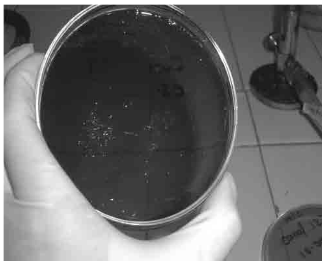
Figura 2. Colonias obtenidas en el agar MB. (Muestra aguas de Lago Timiza).