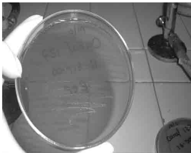
Figura 1. Colonias obtenidas en el agar MC. (Muestra canal de aguas Av. 127).