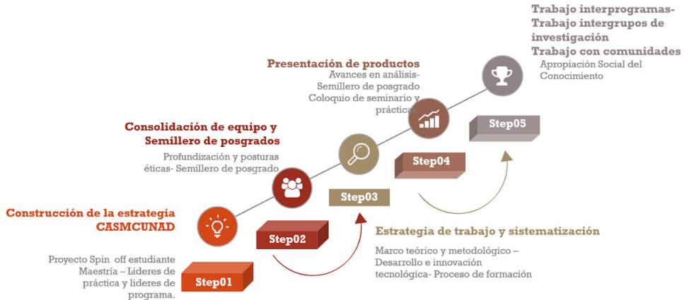
Fuente propia 2021. Paso a paso de la estrategia

con productos tecnológicos y de gran impacto para las comunidades. A continuación, se presentan las siguientes fases de la estrategia.a X.