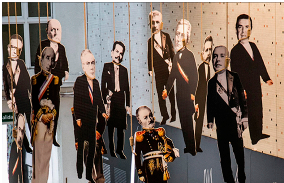
Detalle instalación “El Pago de Chile”

Nota. Instalación de Nicanor Parra en el marco de su exposición Obras Públicas en el Museo Palacio de la Moneda. Santiago de Chile, 2006.