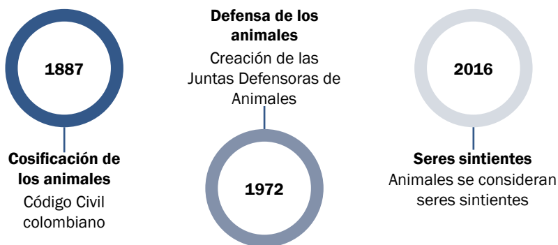
Figura 1. Animales: cosas a seres

En Colombia, los animales fueron inicialmente reconocidos con un estatus cosificador; es decir, considerados como si fueran objetos de propiedad de las personas, para pasar a una consideración distinta que atiende a su condición de seres sintientes. A continuación, en la figura 1, se ilustra de manera sintetizada la transición en la consideración de los animales en Colombia, pasando de ser tratados como cosas a ser identificados como seres sintientes.