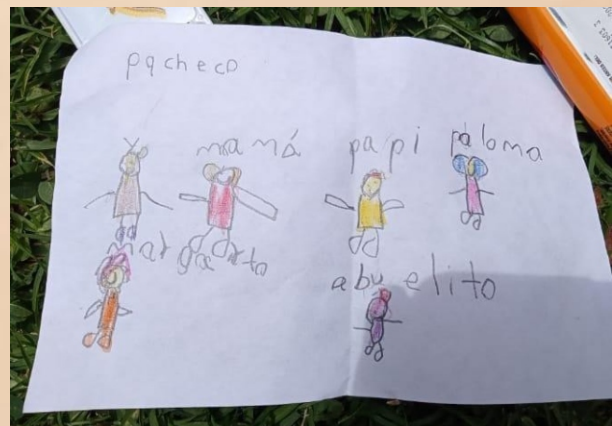
Figura 2. Familias. Los Pacheco.