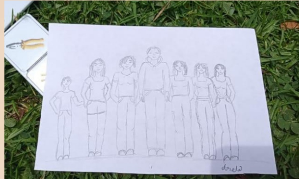
Figura 1. Familias. Los Cagua.